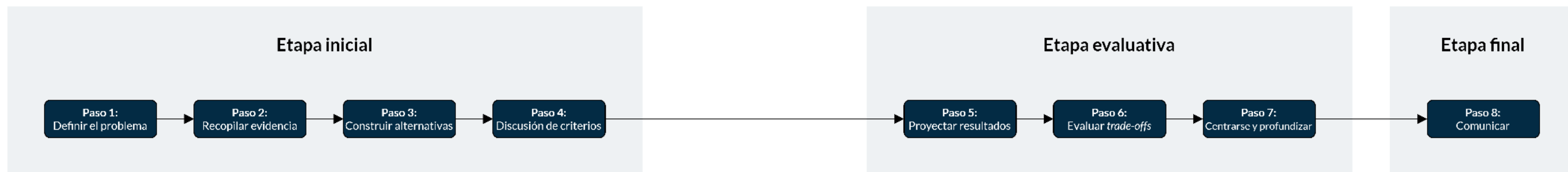
Diagrama de elaboración propia, en base a Bardach (2000)

Bardach plantea en su libro de que la comunicación de política pública debe ser lo suficientemente clara y aterrizada como para que un taxista pueda entender los dilemas y trade-offs mientras realiza una carrera por la ciudad.