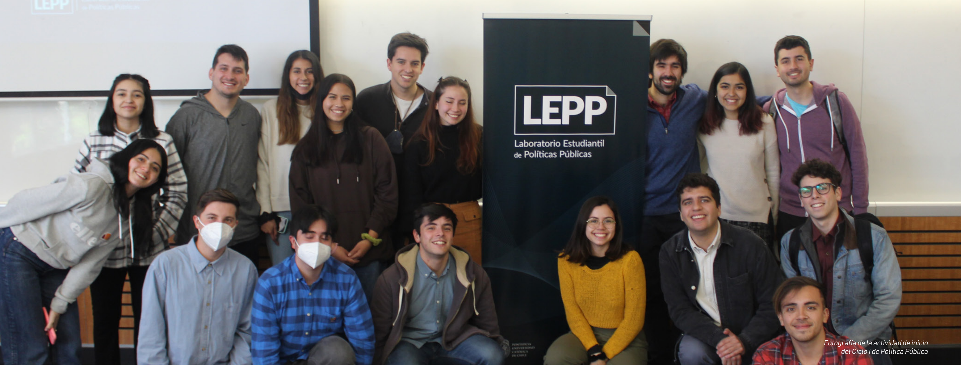
Fotografía de la actividad de inicio del Ciclo I de Política Pública